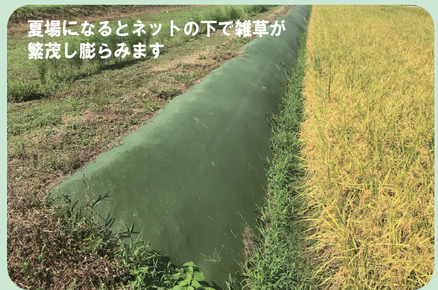
夏場になるとネットの下で雑草が繁茂し膨らみます