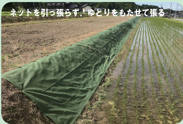
ネットを引張らず、ゆとりをもたせて張る