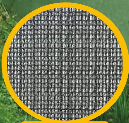
ネット目合い（黒・原寸大）