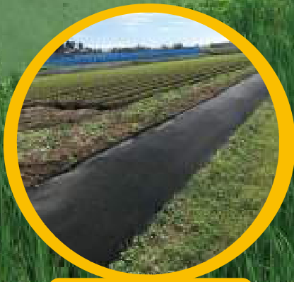
おまかせネット（黒）