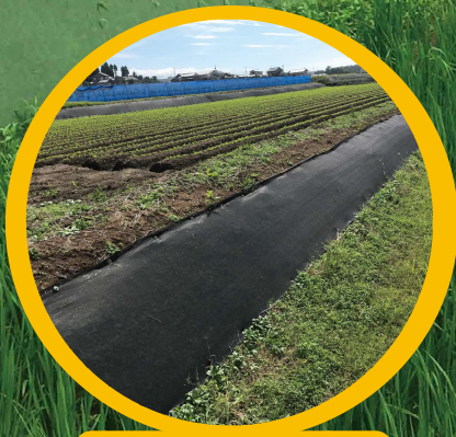
おまかせネット（黒）