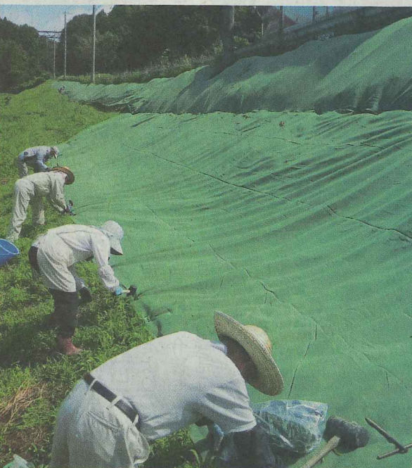
「雑草抑制おまかせネット」の設置作業

滋賀県甲賀市の多面的機能支払交付金の活動組織・小佐治環境保全部会は、同ネットを畦畔の除草の省力化に活用している。地域は標高約2000mの中山間地。畦畔は高低差が大きく、平均で3、4m、高い所で10mある。刈り払い機による除草作業は一苦労で、高齢農家には危険だ。地域では、60%で化学農薬や化学肥料を通常の半分以下に減らした「環境こだわり米」を栽培しており、除草剤にも頼りにくい。そこで、近隣の農家が導入したのを参考に2015年から、同ネットを使い始めた。